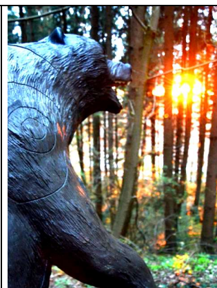
10 Ziele Amerika