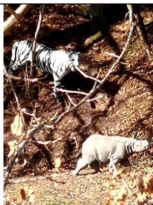
10 Ziele Asien am Bach